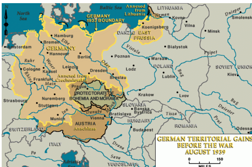
Mapa en el que se ve cómo se fue extendiendo el III Reich antes de la guerra.