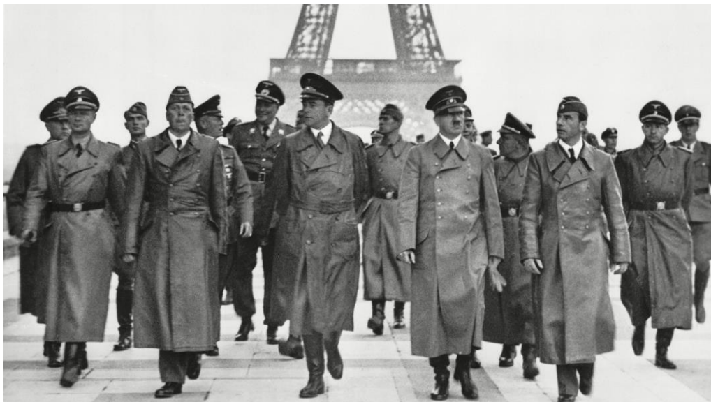
Hitler y otros dirigentes nazis en París, durante la primera etapa de la guerra.