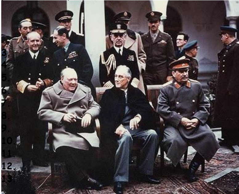
Conferencia de Yalta, febrero de 1945:

Churchill (Reino Unido), Roosevelt (EEUU) y Stalin (URSS)