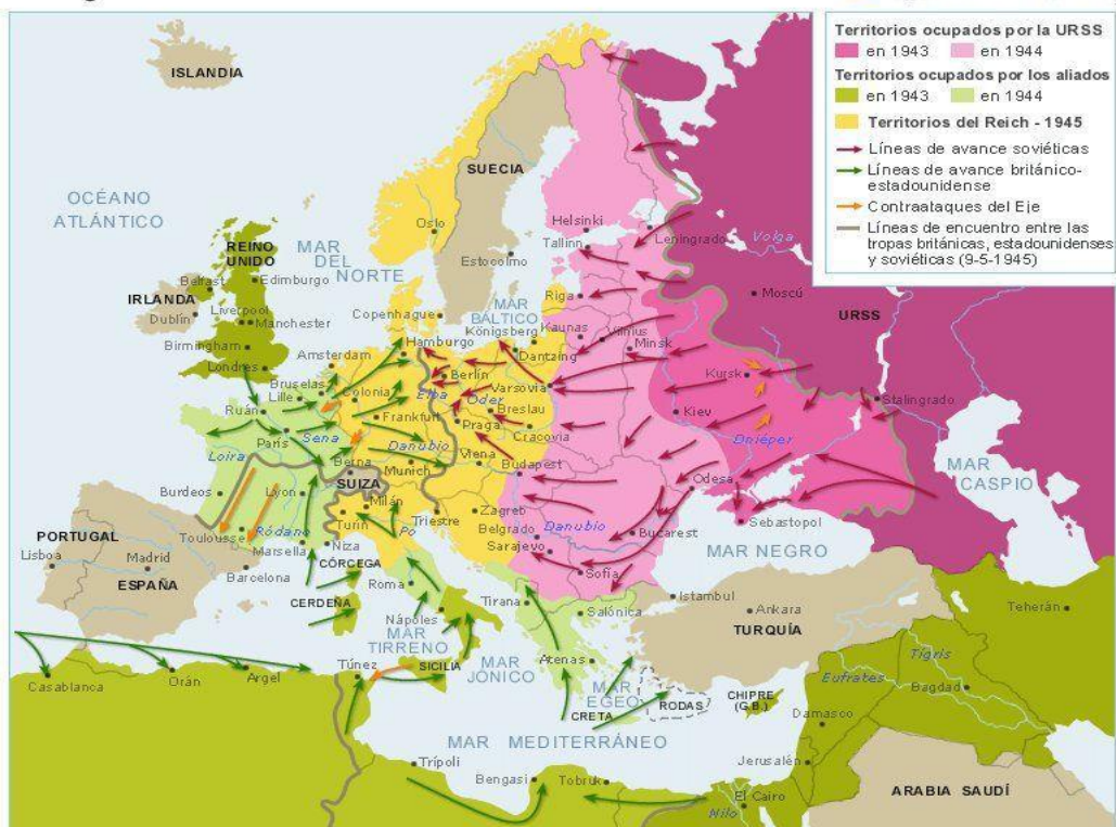
La Segunda Guerra Mundial

Poco a poco, la aviación de EEUU fue conquistando los archipiélagos que estaban en manos de los japoneses (1944) y a principios de 1945 desembarcaron en Iwojima (Japón). Pero Japón tampoco estaba dispuesto a rendirse y enviaba ataques suicidas (los kamikaze), imposibles de evitar. Parecía que la guerra se iba a alargar eternamente así que el nuevo presidente de los EEUU, Truman, decidió lanzar dos bombas atómicas sobre las ciudades japonesas de Hiroshima y Nagasaki (agosto y septiembre 1945). Japón pidió la paz.