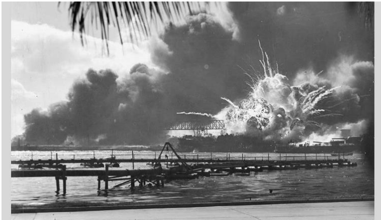
El bombardeo de Pearl Harbor

de EEUU, atacó en diciembre de 1941 Pearl Harbour, en las islas Hawai (que pertenecían a EEUU) y en la primera mitad del año siguiente ocupó Hong Kong, Filipinas, Malasia, Indonesia, Singapur, Birmania, Nueva Guinea y varios archipiélagos del Pacífico.